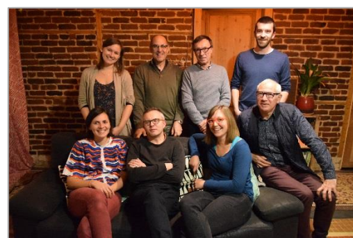
Le conseil de gestion de la SAS Capsol