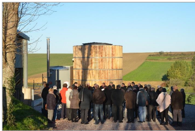
Chaufferie de Zudausques