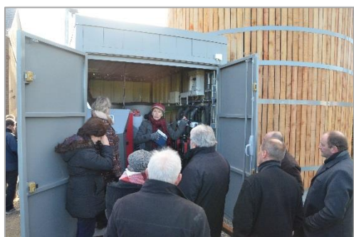
Visite de la chaufferie de Quelmes