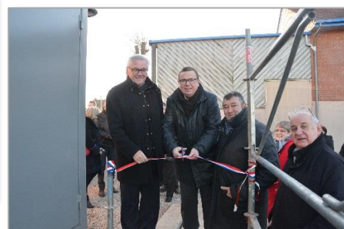
Inauguration de la chaufferie de Zudausques