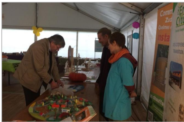
Stand lors de la fête du Gerموir (Ambricourt)