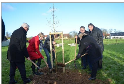
Plantation d'arbres à Quelmes