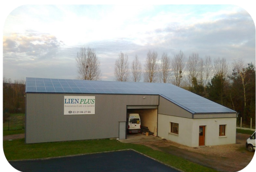
La toiture de Lien PLUS (association d'aide à la mobilité, Beaurainville)