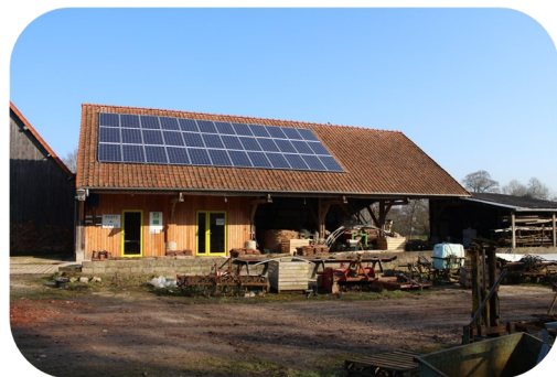
La toiture de Terre de Liens (foncière qui aide les paysans en agriculture biologique à acquérir des terres grâce à la collecte d'épargne collective, Ambricourt)