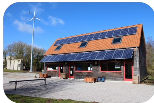
La toiture du Gerموir (espace test agricole pour des maraîchers en agriculture biologique, Ambricourt)

«J'ai toujours voulu investir un peu de mon épargne pour soutenir des projets locaux porteurs de sens.